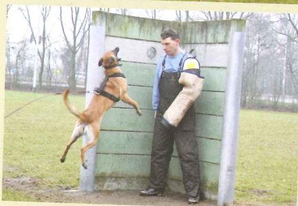
FHC_5591 比约恩·范·斯泰欧训练花絮